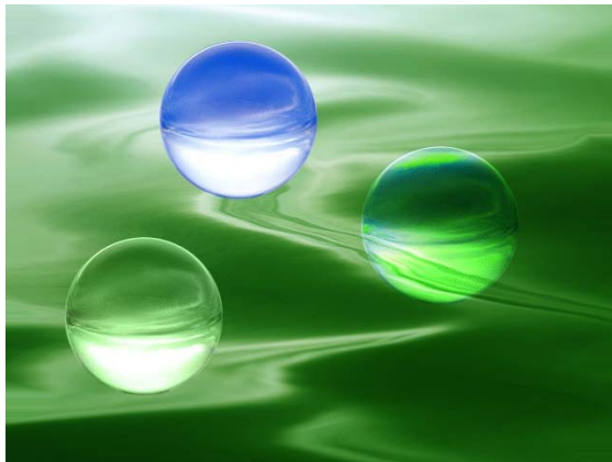
Bulle-sur vague verte.jpg